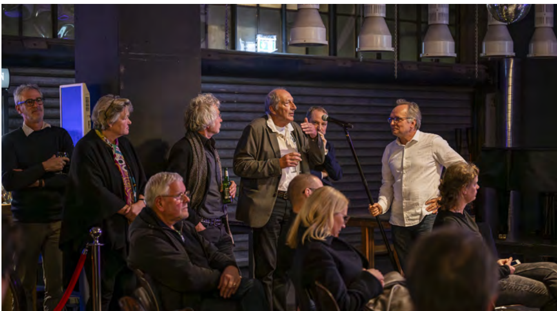
Die Kammerversammlung ist ein Ort des regen Austauschs

Sonderregelung § 3 Abs. 7 S. 2 VgV in Kraft getreten. Ab sofort seien zur Schätzung des Auftragswerts die Gesamtwerte aller für ein Bauvorhaben vorgesehenen Planungs- und Überwachungsleistungen zusammenzurechnen, unabhängig davon, ob es sich um gleichartige Leistungen handele oder nicht. Der so errechnete Auftragswert werde dadurch künftig in aller Regel oberhalb der EU-Schwellenwerte für Planungsleistungen in Höhe von 215.000 Euro liegen, was die Pflicht zu EU-weiten Ausschreibungen nach sich zöge. Um die Vielzahl der daraus resultierenden EU-weiten Ausschreibungen zu vermeiden, würden sicherlich viele öffentliche Auftraggeber, insbesondere die Kommunen, wie bereits angekündigt, Leistungen zusammenfassen zu Generalplanungsaufträgen oder sogar zu Totalunternehmeraufträgen. Die Konsequenzen der VgV-Änderung seien somit immens und derzeit noch gar nicht absehbar. Umso erfreulicher sei die Hamburger Reaktion: In einem Rundschreiben habe die Behörde für Stadtentwicklung und Wohnen erläutert, dass die Planungsleistungen mit den Bauleistungen zusammengerechnet werden könnten, wodurch dann statt des Schwellenwertes für die Planungsleistungen in Höhe von 215.000 € derjenige für Bauleistungen von 5,382 Mio. €